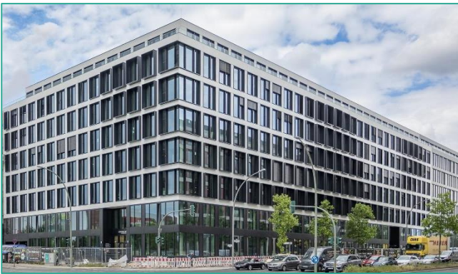
DLR-PT Berlin Südkreuz, BZ